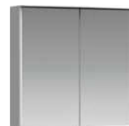
Зеркальный шкаф 80 см NER0408

Зеркальный шкаф с двумя дверьми, светодиодным светильником, также освещающим внутреннее пространство, сенсорным выключателем и регулятором освещенности Ш: 80 – В: 76 – Г: 17