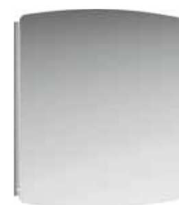
Зеркало 80 см NER0208

Зеркало со светодиодной подсветкой в металлическом профиле, системой обогрева от запотевания, а также двумя выключателями, которые позволяют включить обогрев и освещение как отдельно, так и совместно Ш: 80 – В: 82 – Г: 3