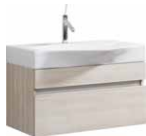
Тумба 80 см Умывальник Bergamo 800 Вер.01.08/(A/W) Вер.08.04.D Подвесная тумба с двумя ящиками в цвете акация/белый под умывальник из литьевого мрамора Ш: 80 – В: 51 – Г: 51