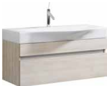
Тумба 100 см Умывальник Bergamo 1000 Вер.01.10/(A/W) Вер.10.04.D Подвесная тумба с двумя ящиками в цвете акация/белый под умывальник из литьевого мрамора Ш: 100 – В: 51 – Г: 51