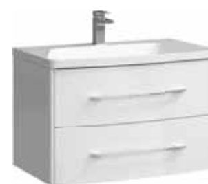
Тумба 80 см Умывальник Neringa 800 NER0108 Ner.08.04.D

Подвесная тумба в цвете белый глянец с двумя ящиками под умывальник из литьевого мрамора Ш: 80 – В: 54 – Г: 48