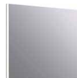
Зеркало 80 см SM0208

Зеркало со светодиодной подсветкой в металлическом профиле, сенсорным выключателем и регулятором освещенности Ш: 80 – В: 70 – Г: 3