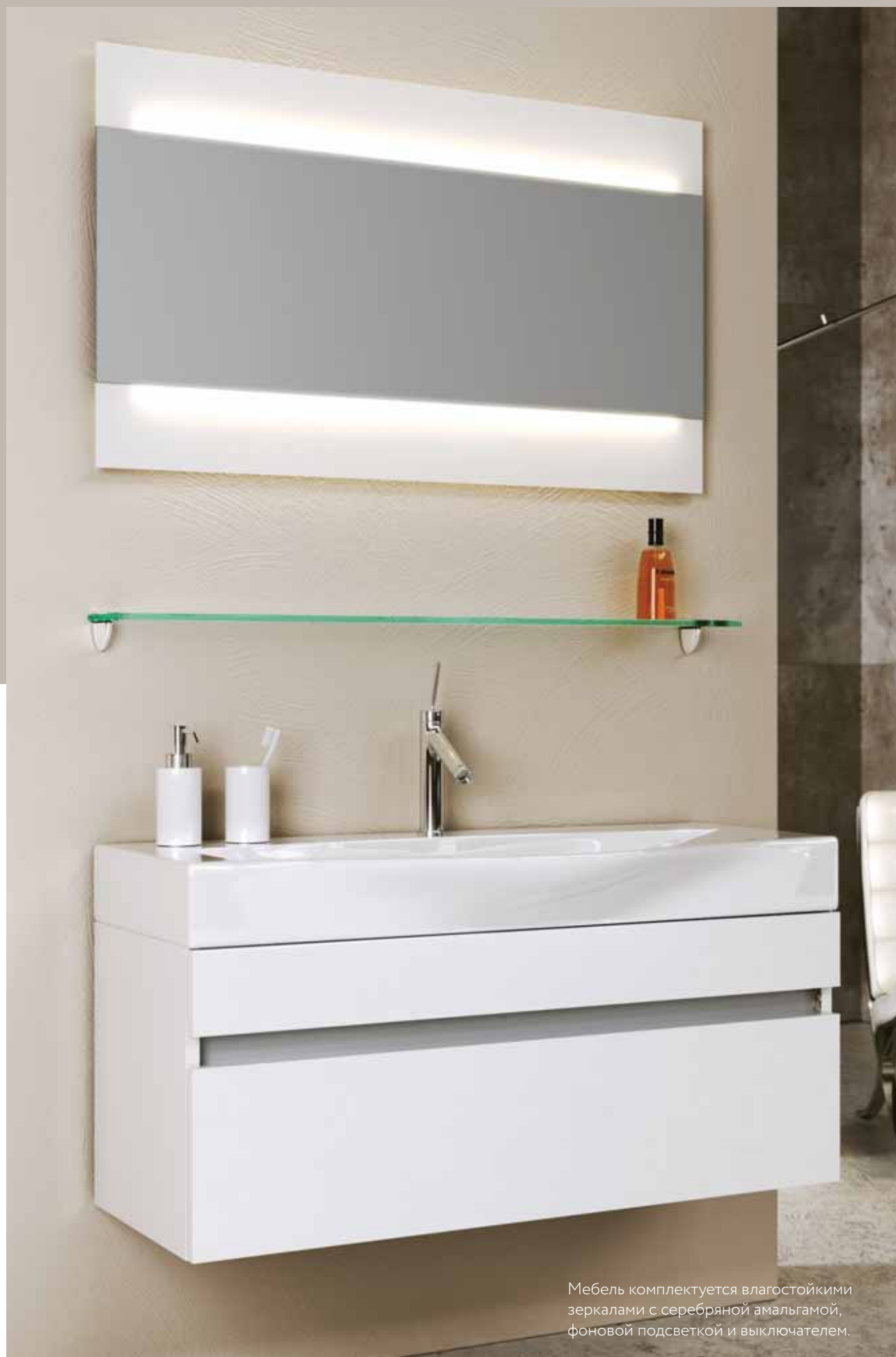
Мебель комплектуется влагостойкими зеркалами с серебряной амальгамой, фоновой подсветкой и выключателем.