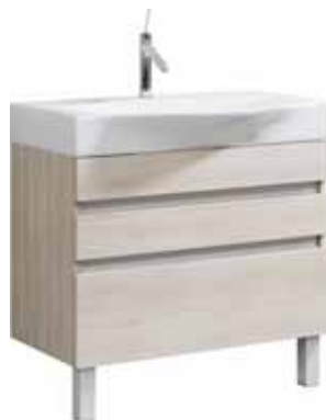
Тумба 80 см Умывальник Bergamo 800 Вер.01.08/п/(A/W) Вер.08.04.D Напольная тумба с тремя ящиками в цвете акация/белый под умывальник из литьевого мрамора Ш: 80 – В: 86 – Г: 50