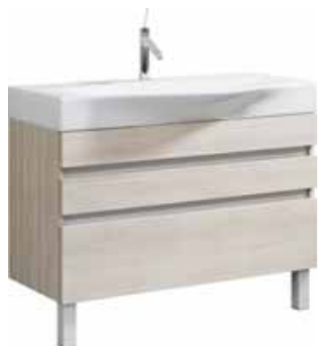
Тумба 100 см Умывальник Bergamo 1000 Вер.01.10/п/(A/W) Вер.10.04.D Напольная тумба с тремя ящиками в цвете акация/белый под умывальник из литьевого мрамора Ш: 100 – В: 86 – Г: 50